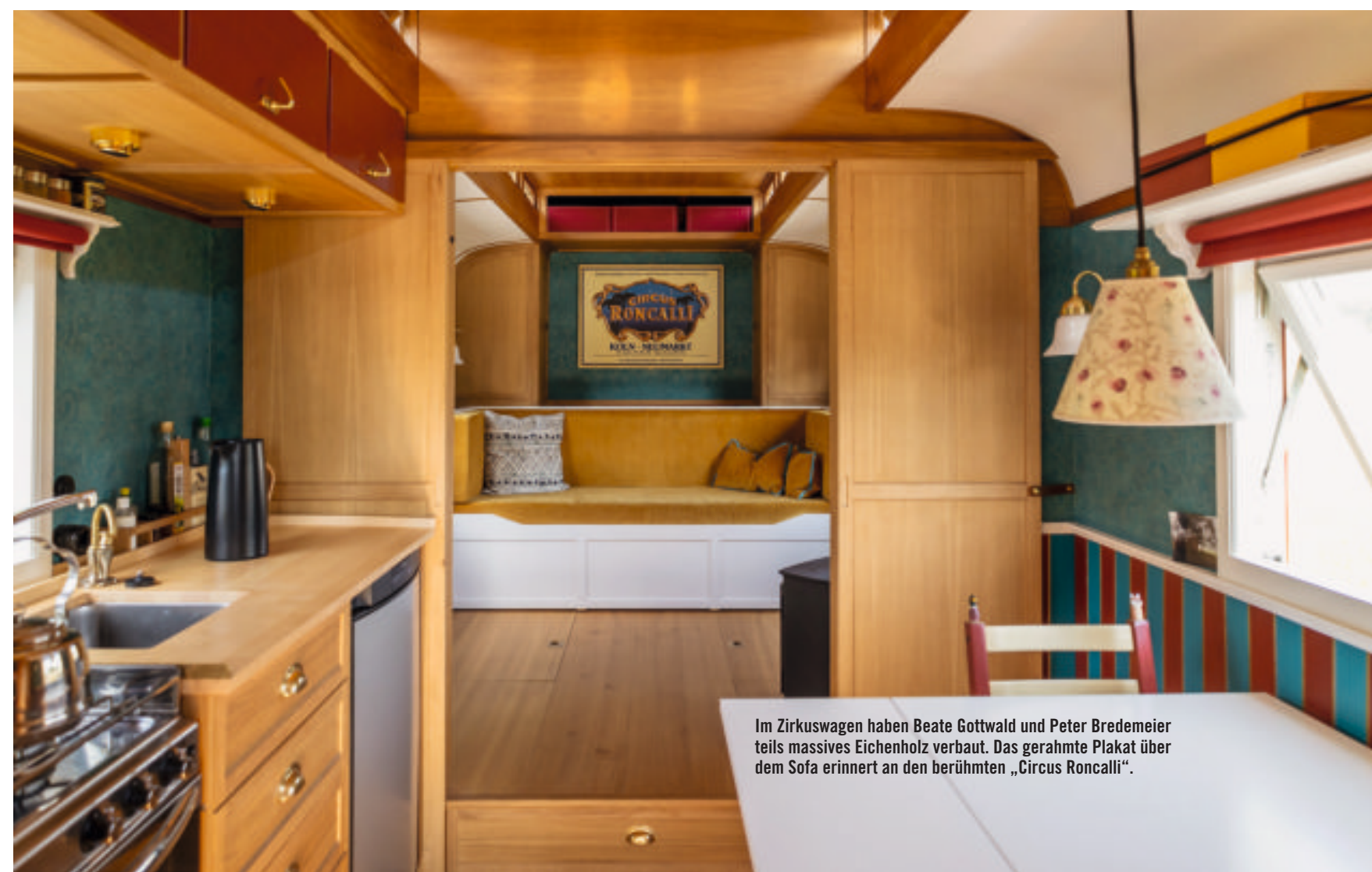
Im Zirkuswagen haben Beate Gottwald und Peter Bredemeier teils massives Eichenholz verbaut. Das gerahmte Plakat über dem Sofa erinnert an den berühmten „Circus Roncalli“.

drinnen kühl, zusätzlich zur Gasheizung sorgt ein Ofen für Wärme im winterfesten Wagen bei Temperaturen bis zu minus 20 Grad. In der Küche gibt es einen Herd, einen Backofen und einen Kühlschrank. „Wir haben alles, was wir brauchen, auf kleinem Raum und üben schon jetzt das Leben in unserem mobilen Haus“, erläutert Peter Bredemeier. Mehrfach haben sie die Zeit in und mit ihrem Zirkuswagen verbracht – in Schweden, im Wendland oder im Münsterland. Sie fragen Landwirte, ob und wie lange sie auf einer Wiese stehen dürfen. Sie stellen sich auch auf Wanderparkplätze und fahren Campingplätze an. In Deutschland dürfen sie bis zu zehn Stunden auf Parkplätzen stehen, in Schweden bis zu 24 Stunden.