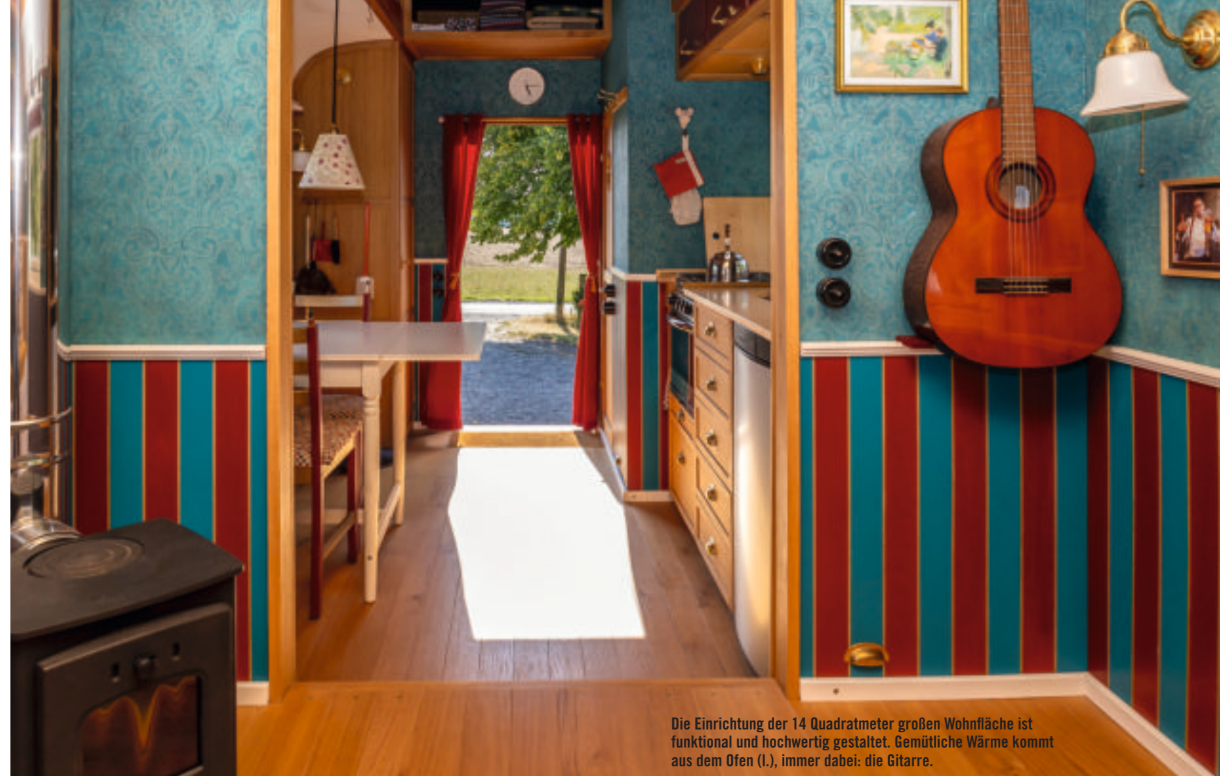
Die Einrichtung der 14 Quadratmeter großen Wohnfläche ist funktional und hochwertig gestaltet. Gemütliche Wärme kommt aus dem Ofen (l.), immer dabei: die Gitarre.